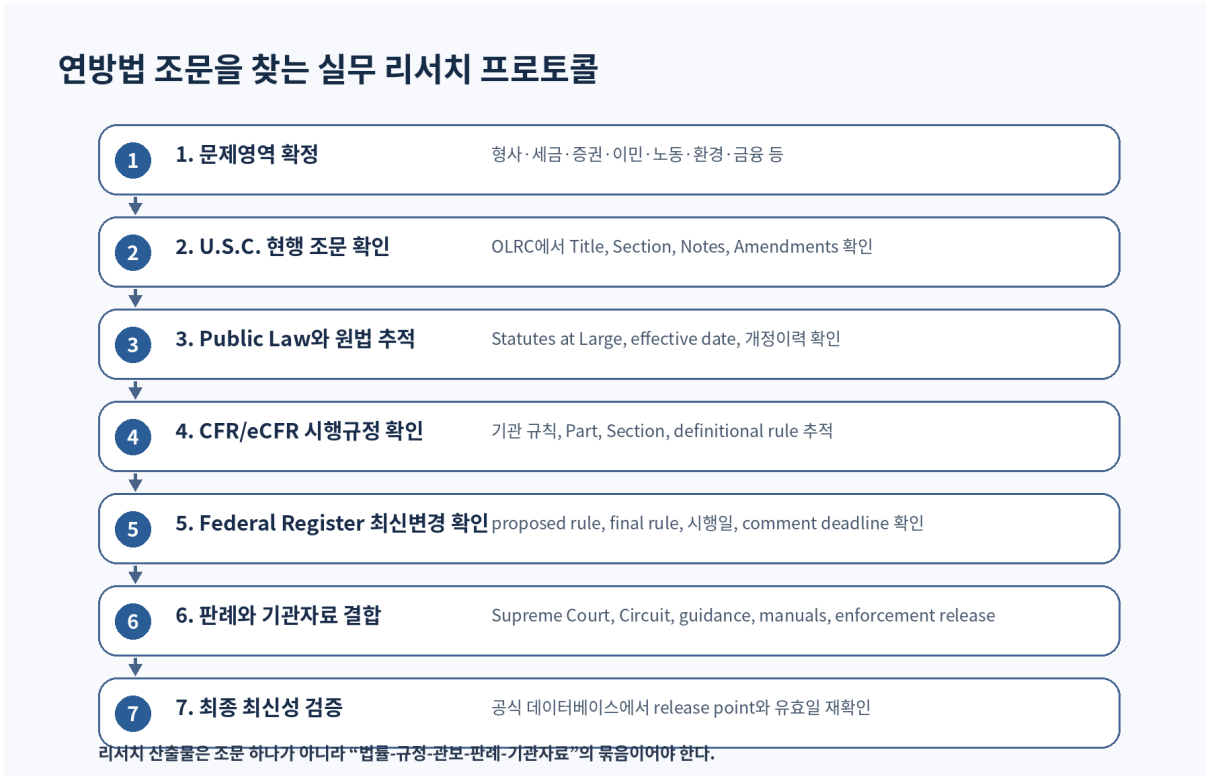
그림 4. 연방법 조문을 찾는 실무 리서치 프로토콜

실무 리서치의 목적은 “관련 조문 하나”를 찾는 것이 아니라, 해당 사안을 지배하는 법적 운영체계를 재구성하는 것이다. 예컨대 증권사기의 경우 Title 15의 조문, SEC 규정, SEC release, no-action 또는 interpretive 자료, Supreme Court 및 Second/Ninth Circuit 판례, 소멸시효, private right of action, pleading standard 가 함께 검토되어야 한다.