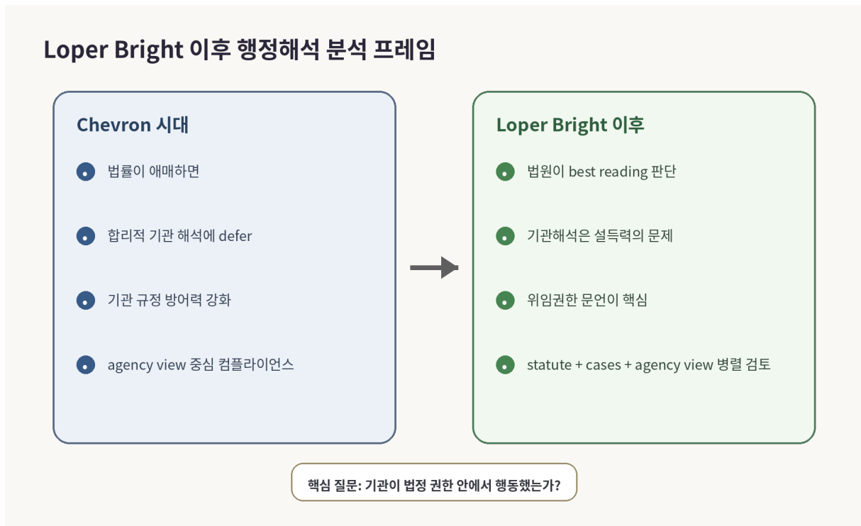
그림 3. Loper Bright 이후 행정해석 분석 프레임

2024 년 Supreme Court 의 Loper Bright Enterprises v. Raimondo 는 Chevron deference 를 폐기했다. 대법원은 APA 상 법원이 기관이 법정 권한 안에서 행동했는지 독립적으로 판단해야 하며, 법률이 애매하다는 이유만으로 기관의 해석에 구속적으로 defer 할 수 없다고 판시했다. [9]